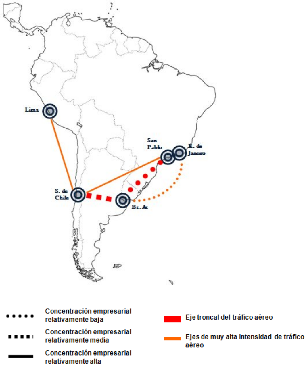
GRAFICO III: LAS 5 PRINCIPALES RUTAS EN TRÁFICO AEROCOMERCIAL DE AMÉRICA DEL SUR PARA 2011